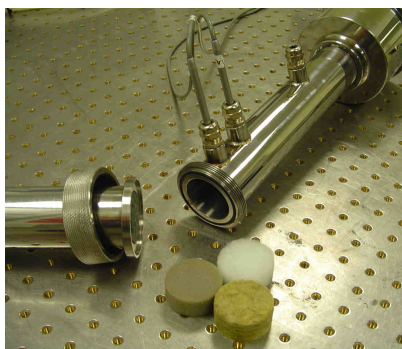
Détails du tube de 45mm de diamètre

Le tube de Kundt permet la mesure du coefficient d'absorption et de l'impédance de surface de matériaux acoustiques. Les essais sont réalisés selon la norme NF EN ISO 10534-2 (méthode de la fonction de transfert).